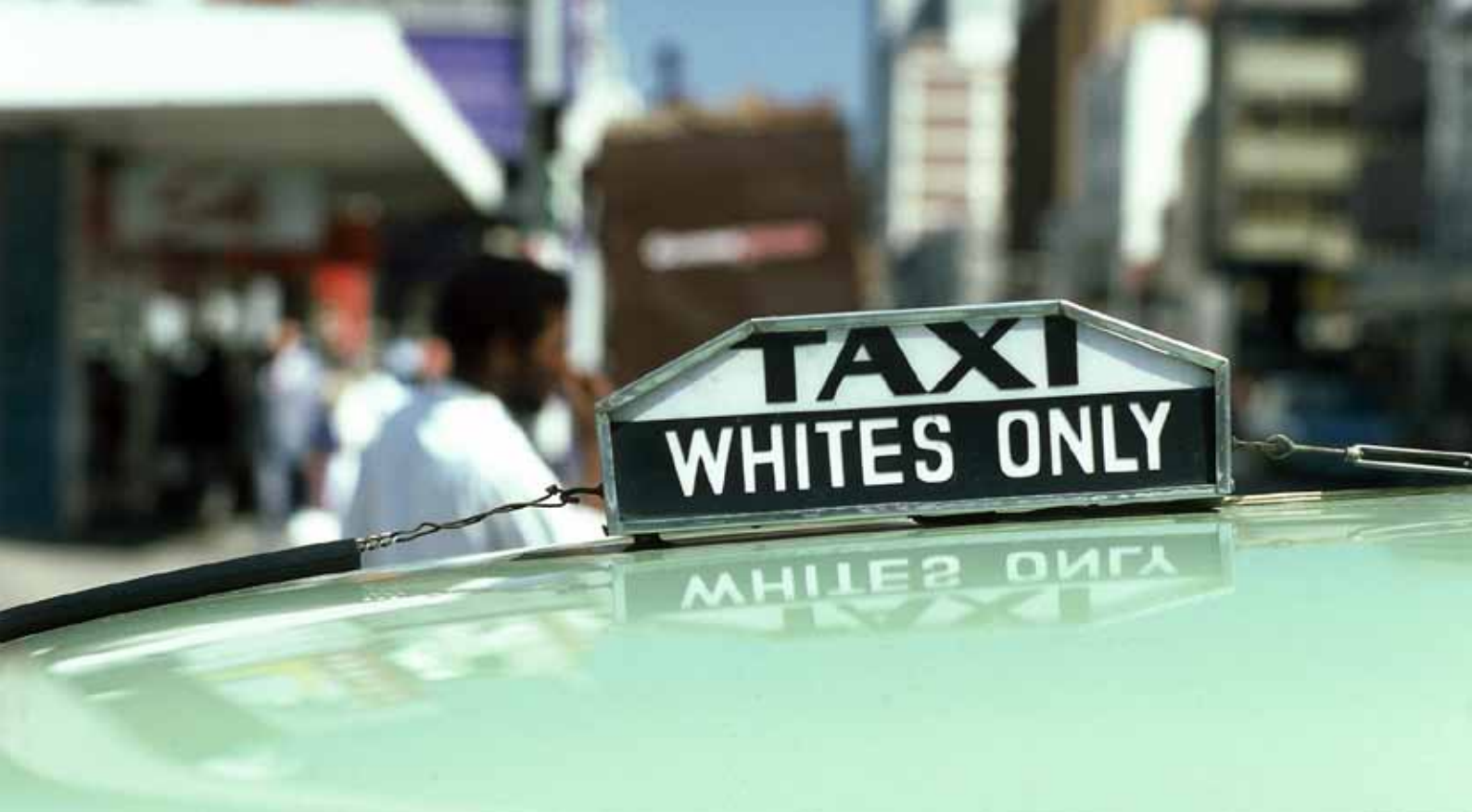
Solche Schilder sucht man in Israel vergeblich (Pretoria, 1972)