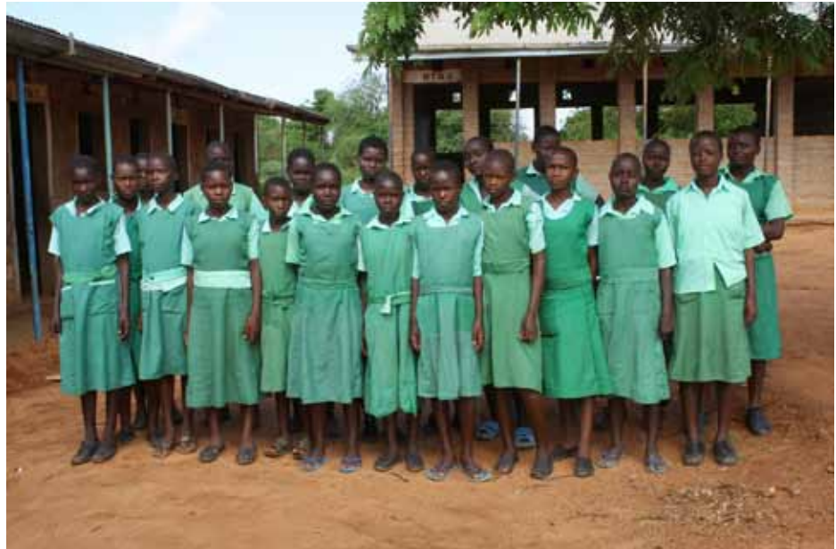
Alltägliche Disziplinierung. Schule in Kenia 2014

Bereits seit den frühen 1970er Jahren sind Studien entstanden, welche die historische und geografische Begrenztheit der westlichen Kindheitskonstruktionen aufzeigten. So stellte etwa der französische Historiker Philippe Ariès (1975) in seiner zuerst 1960 erschienenen »Geschichte der Kindheit« die vermeintliche Überzeitlichkeit und