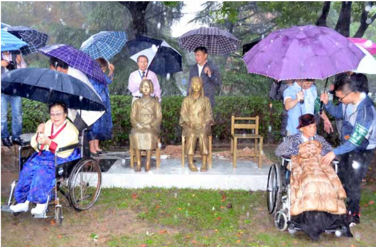
Im Oktober 2016 wurde diese Gedenkstatue vor der Universität von Shanghai errichtet