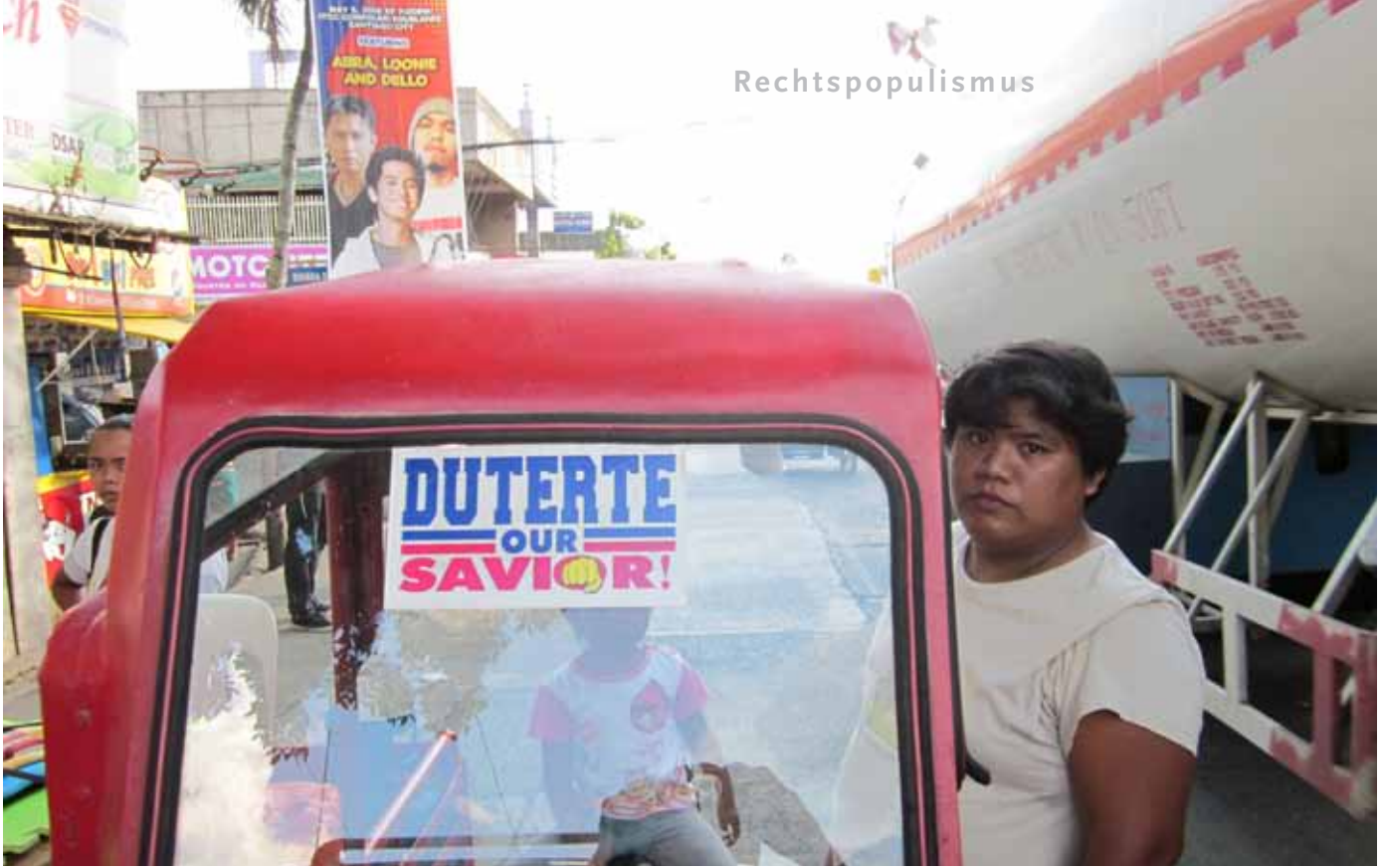
In der Rolle als Rächer der Enterbten hat Duterte bislang großen Erfolg