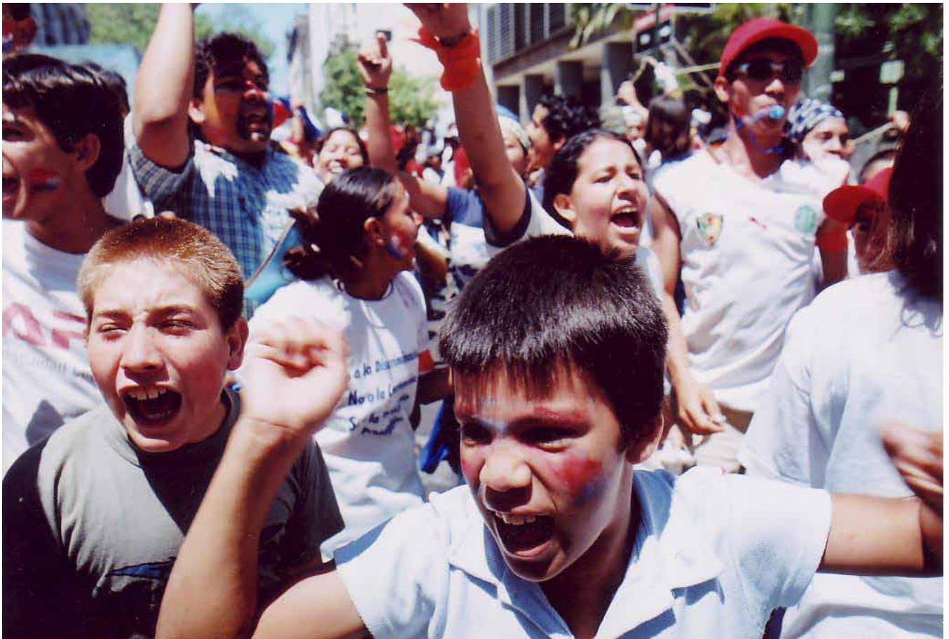
Demonstration der Kinderrechtsorganisation MOLACNATS.ORG in Paraguay