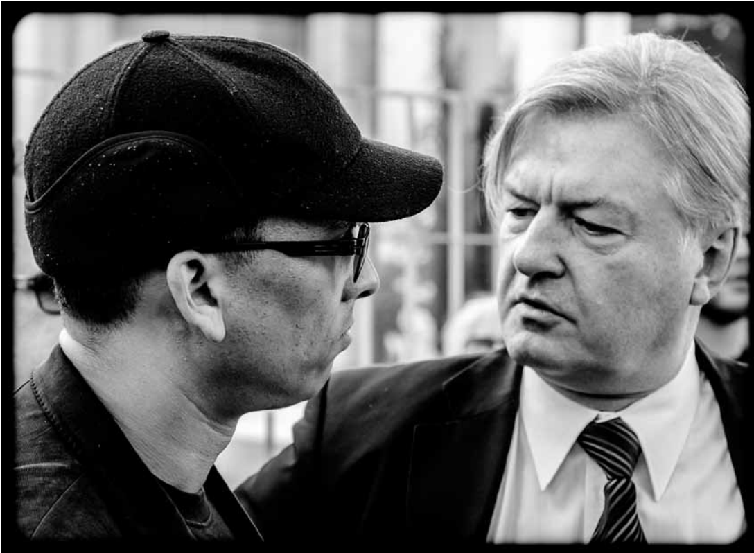
Xavier Naidoo und Jürgen Elsässer verabreden Verschwörungen