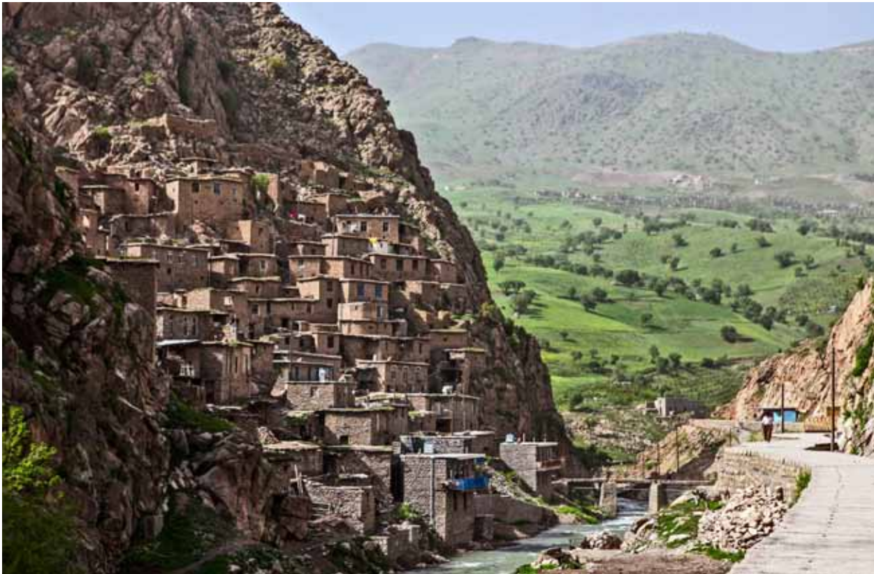
Ob es sich hier um Ekincis Walnusstal handelt?