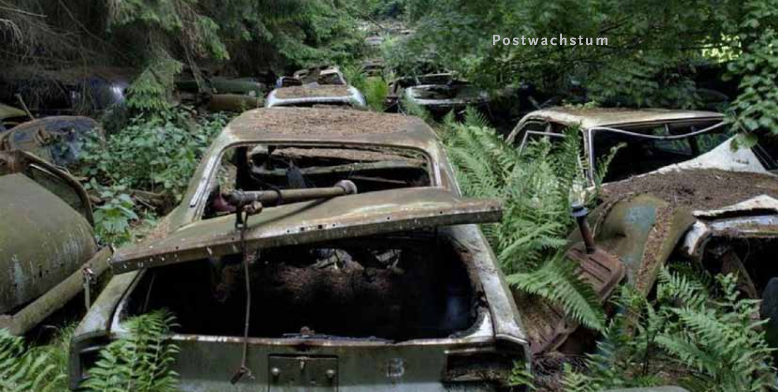
Ein solcher Verkehrsstau ist ganz im Sinne von Postwachstum