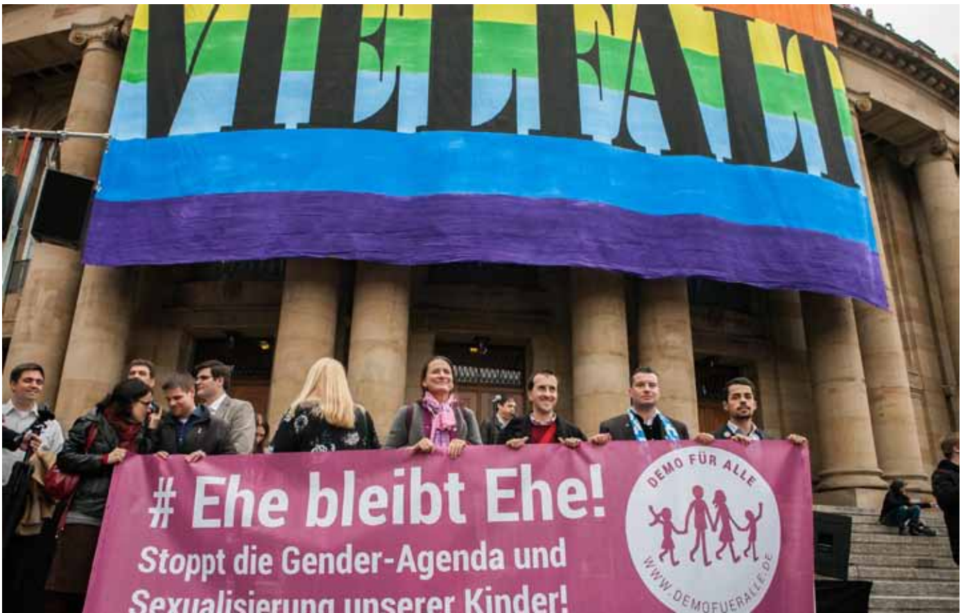
»Demo für alle« zugunsten sexueller Vielfalt: Die Stuttgarter Oper hält dagegen