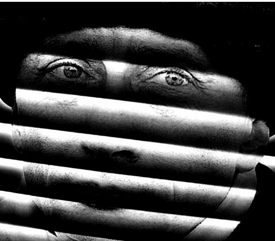
Er ist überall