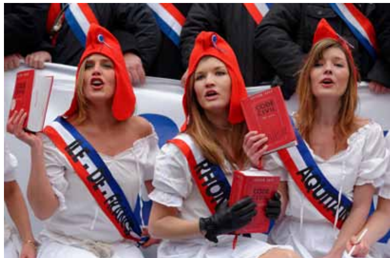
»Manif pour tous« in Paris: Mit dem Code Civile gegen Rechte für LGTBs

schlechtsumwandlung« von Volker Zastrow, dem Chef des Politikressorts. Zastrow beschwert sich über Gender Mainstreaming, unter anderem da es ausschließlich Frauen fördere. Der Titel des Artikels ist typisch für die darauf folgende, oft polemisch und überspitzt geführte Debatte in weiteren großen Zeitungen. In vielen Artikeln und besonders in LeserInnenkommentaren wird nahe gelegt, dass Gender Mainstreaming die Menschen zwanghaft umerziehe – mit dem Ziel, einen neuen (geschlechtslosen) Menschen zu erschaffen.