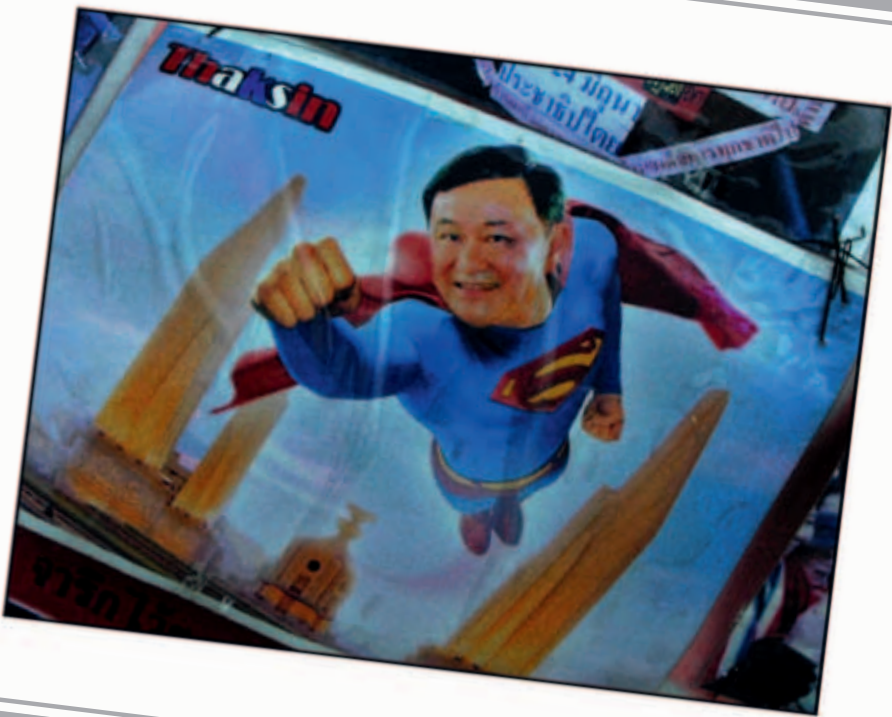
Superthaksin. Der Held des Volkes